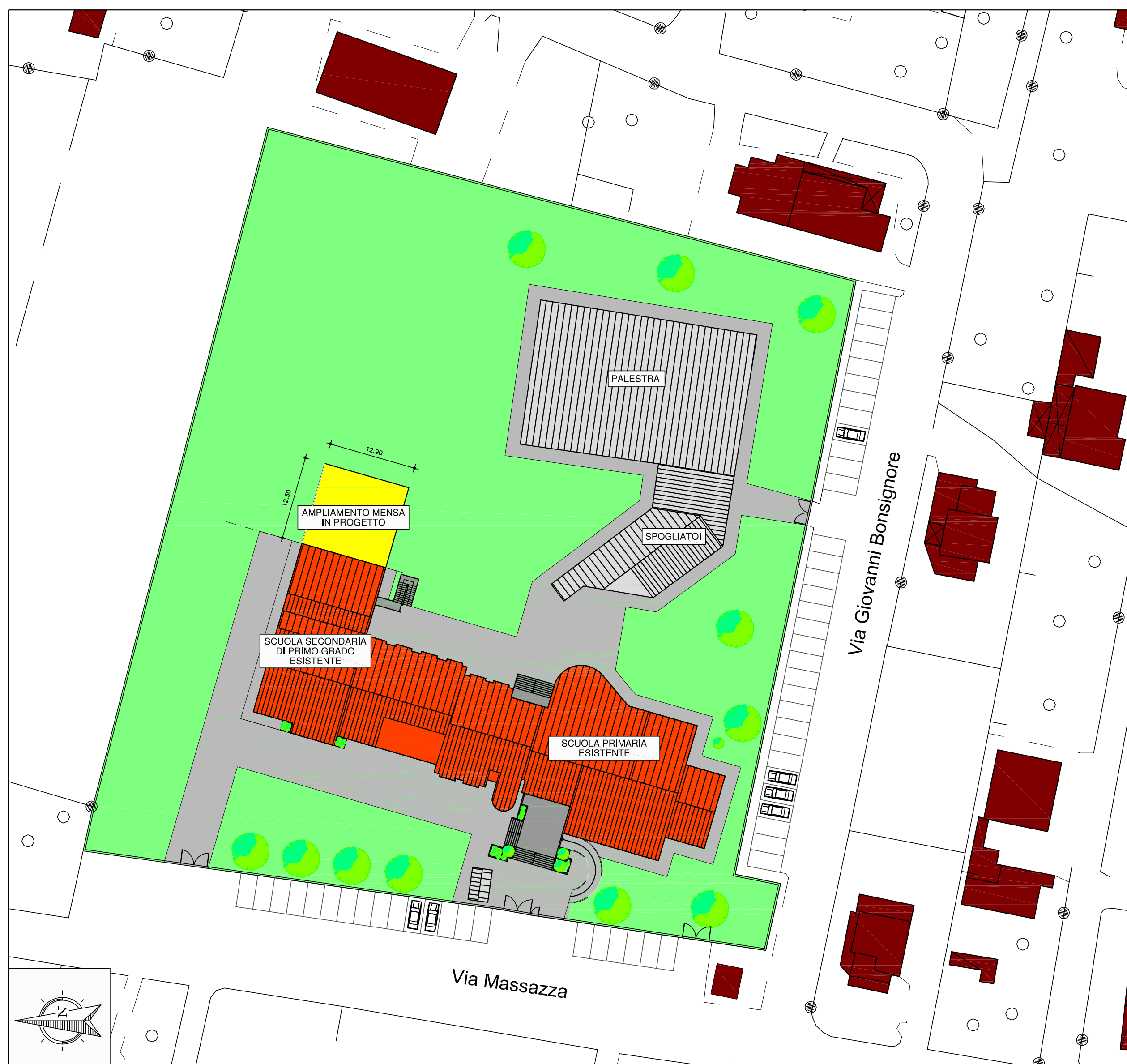
PLANIMETRIA GENERALE - scala 1:500 -

STUDIO MOSSOLANI - Via della pace 14 - 27045 Casteggio (Pavia) - Telefono: 0383/890096 - E-mail: info@studiomossolani.it